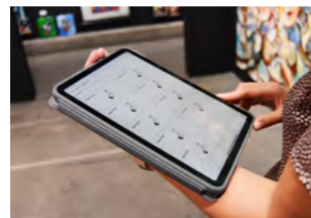
diverse instellingen mogelijk via de sensetrack app